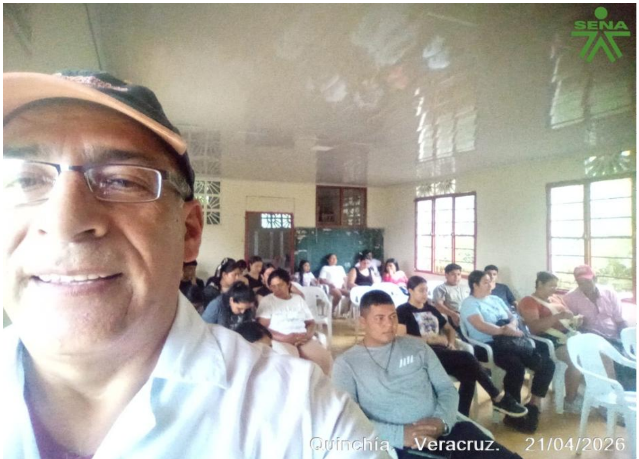
Quinchía. Veracruz. 21/04/2026