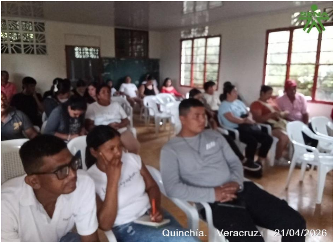
Quinchía. Veracruz. 21/04/2026